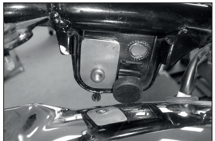
Ansicht von innen; Fahrtrichtung ⇒

Zur Verschraubung der Brücke die Linsenkopfschrauben M8 x 25 mit U-Scheiben verwenden.